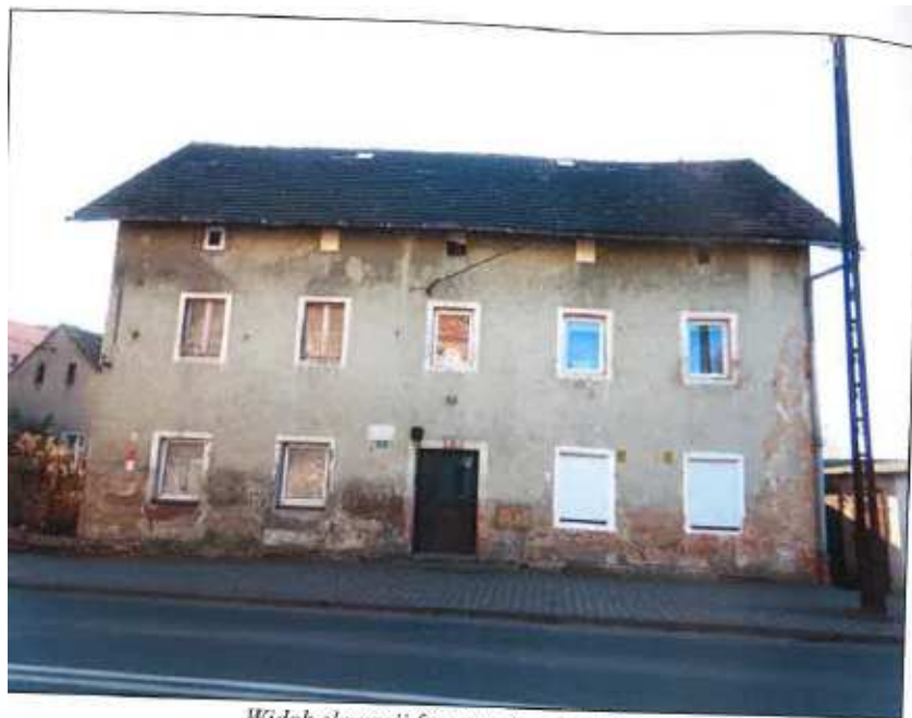
Widok elewacji frontowej – ul. Leśna.

na sprzedaż lokalu mieszkalnego Nr 6, znajdującego się w budynku położonym w Lubaniu przy ul. Leśnej 11 wraz z udziałem we współwłasności nieruchomości gruntowej (działka nr 27, AM 15, Obręb V o powierzchni 105 m 2 , JG1L/00016302/2)