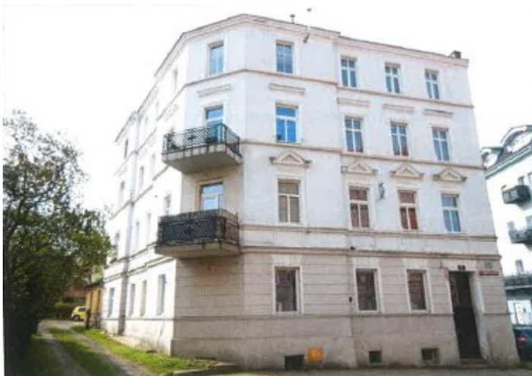
Ogólny widok budynku

na sprzedaż lokalu mieszkalnego Nr 9 znajdującego się w budynku położonym w Lubaniu przy ul. Armii Krajowej 24 (JG1L/00035661/5) wraz z udziałem we współwłasności nieruchomości gruntowej (działka nr 49/5, AM 19, Obręb II o powierzchni 248 m 2 , JG1L/00016414/0)